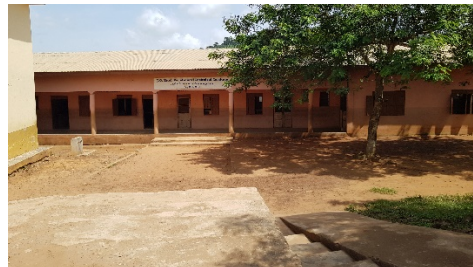
J.G.Knol Technical School