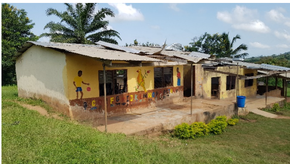
Saforo - huidige JHS

Het project proberen we van de grond te krijgen samen met de Stichting de Wilde Ganzen en de Stichting Bijzondere Doeleinden, als financiers. Momenteel zijn we druk bezig om te voldoen aan de financiële eisen die hieraan gesteld worden en werken we hard aan de goedkeuring van de NGO-Ghana.